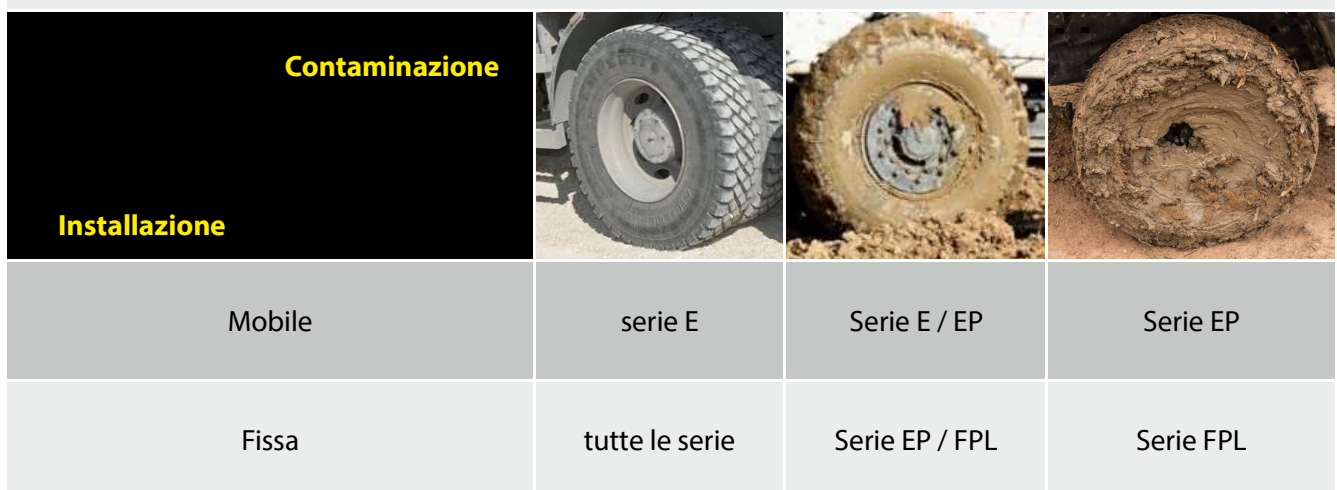
Tabella di scelta rapida

Lavapesa: innovazione, efficienza e rispetto per l'ambiente in un'unica soluzione.